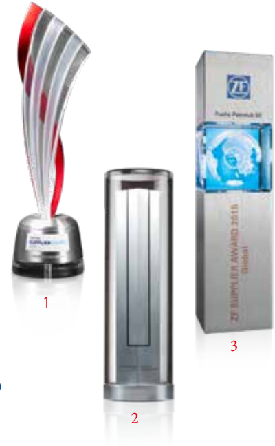
1 DAIMLER SUPPLIER AWARD